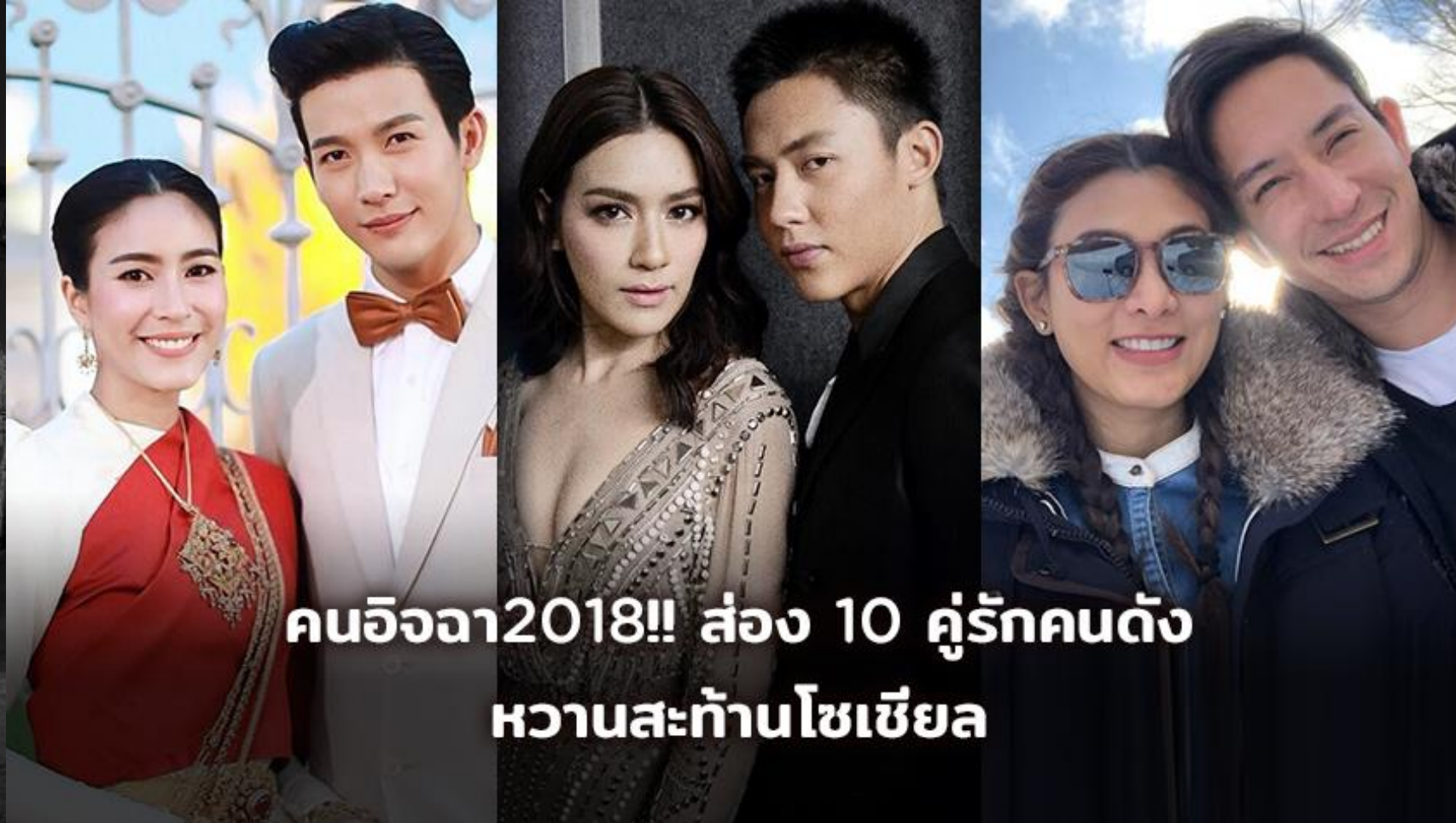
คนอิจจา2018!! ส่อง 10 คู่รักคนดัง หวานสะก้านโซเซี่ยล