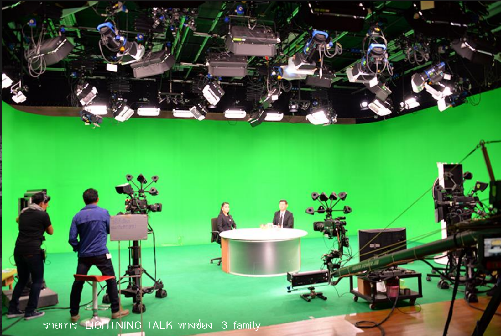
รายการ LIGHTNING TALK ทางช่อง 3 family