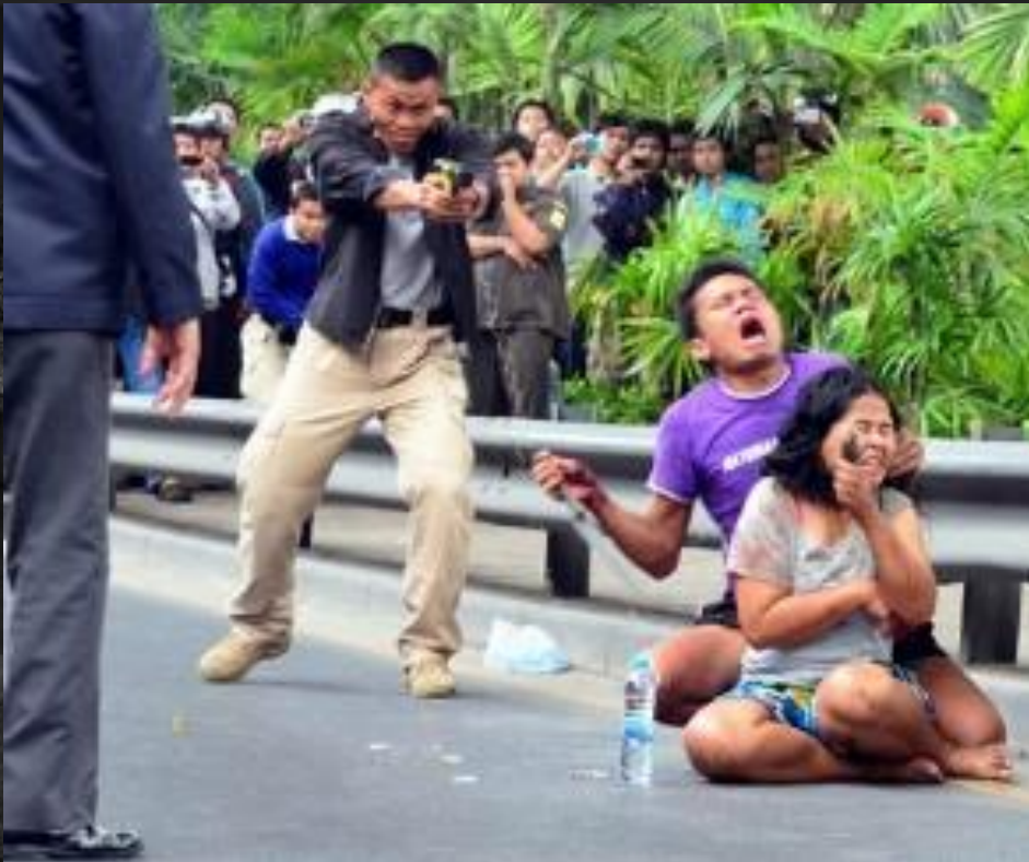
"สยบคลั่ง 1"

เป็นภาพสื่อความหมายและอารมณ์ของข่าวได้ทันที ตรงกับหลัก 5w 1