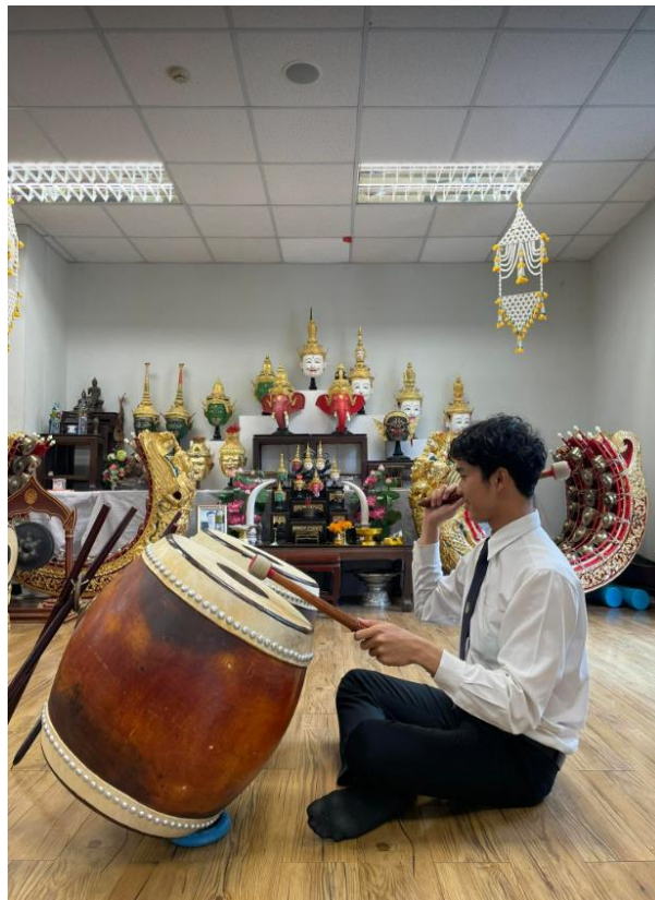
การนั่งตีตะโพน-กลองตัดด้านข้าง