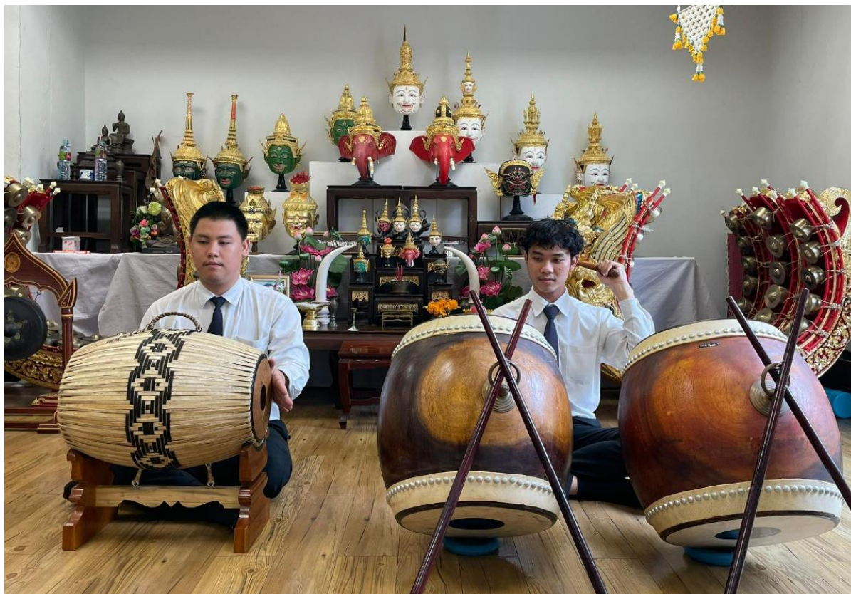
การนั่งตีตะโพน-กลองทัด