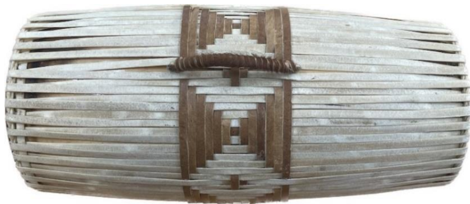
หุ่นกลองสองหน้า

ลักษณะทางกายภาพของกลองสองหน้ามาจากลูกของเปิงมาง แต่ลักษณะใหญ่กว่าลูกเปิง ขนาดลำตัว (หุ่นกลอง) ทำด้วยไม้ จึงหนังสองหน้า หน้าใหญ่หรือหน้ารุ่ม หน้าเล็กหรือหน้ามัด ดังภาพประกอบ