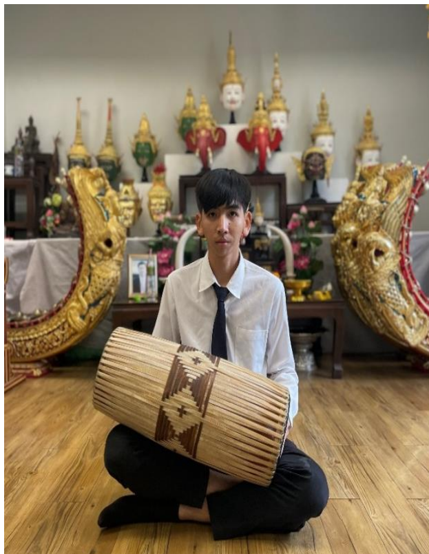
การนั่งตีกลองสองหน้ากรณีไม่ชันเข่า