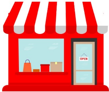
ร้านค้า หรือ แพลตฟอร์ม