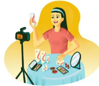
คอนเทนต์ ครีเอเตอร์