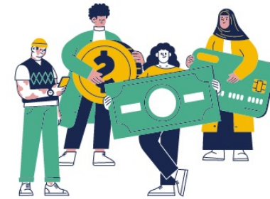
ลูกค้า หรือ ผู้ติดตาม