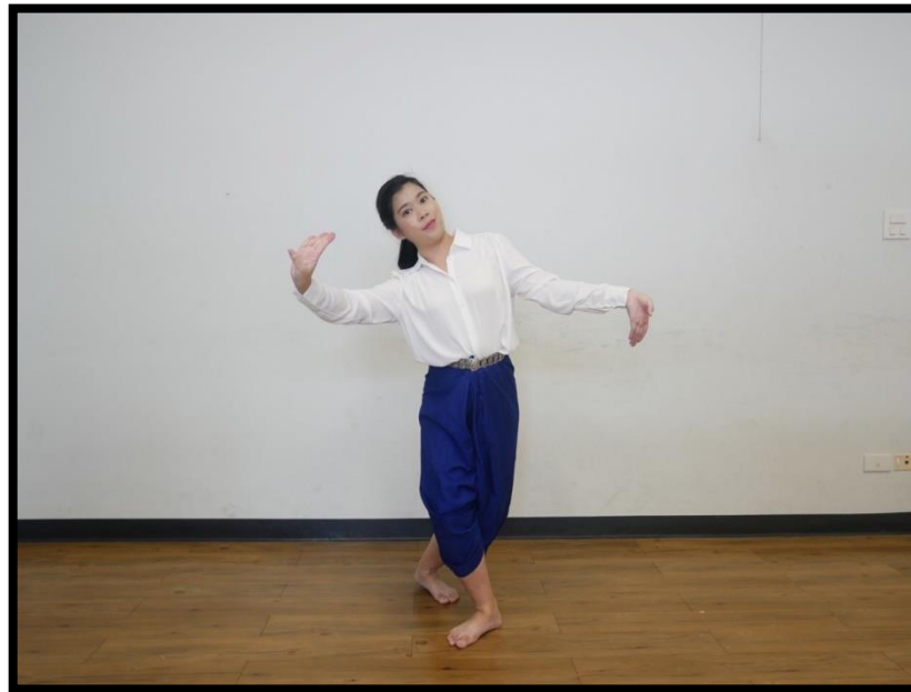
ท่าพลาเพียงไหล่ต่วนาง