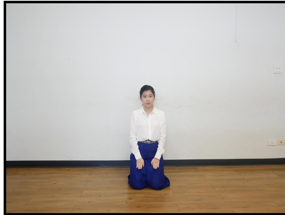
ทำนั่งคุกเข่าตัวนาง