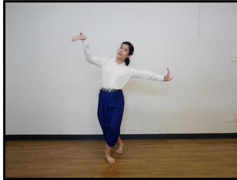
ท่าสอดสูงตัวนาง