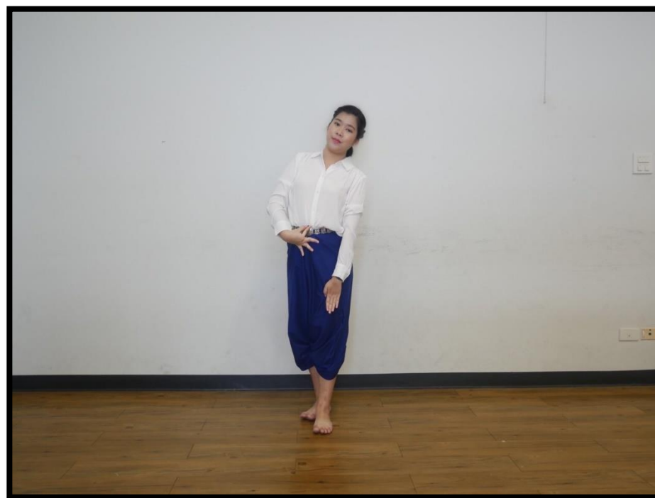
ทำยืนตัวนาง