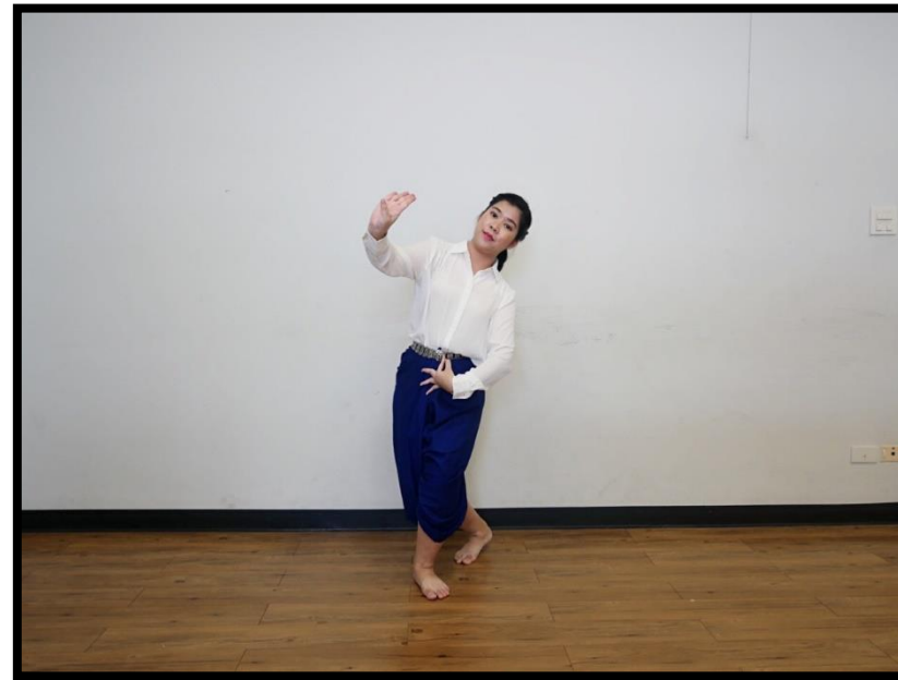
ท่าสอดสร้อยมาลาตัวนาง