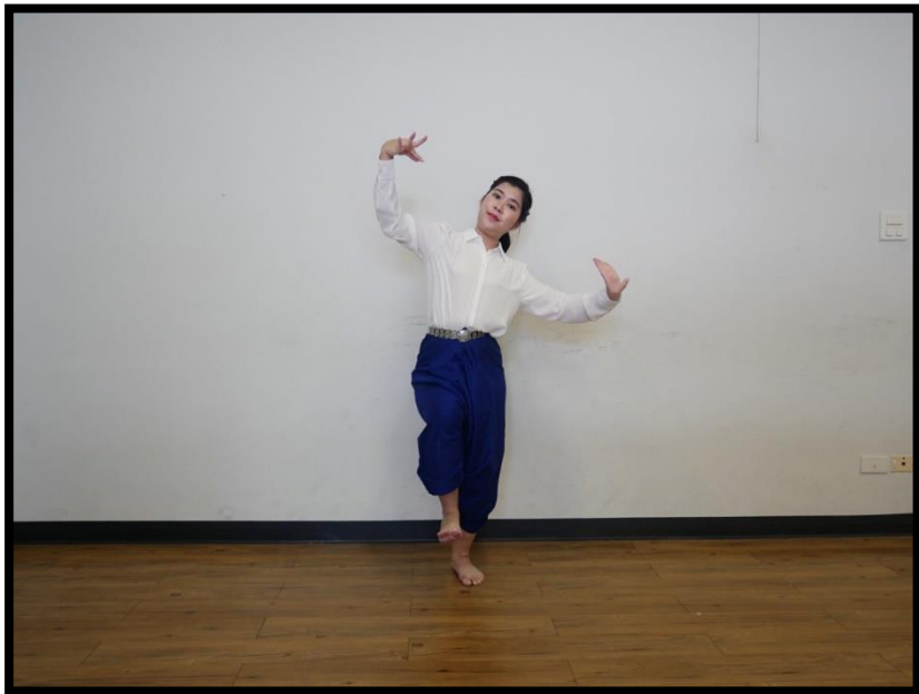
ท่าเชื่อม