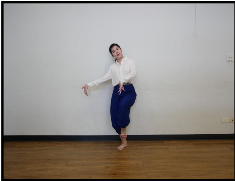
ท่าเชื่อม