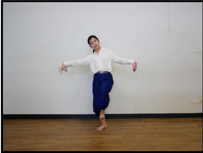
ท่าเชื่อม