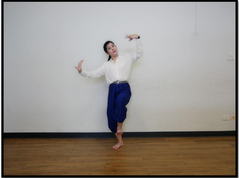
ท่าเชื่อม