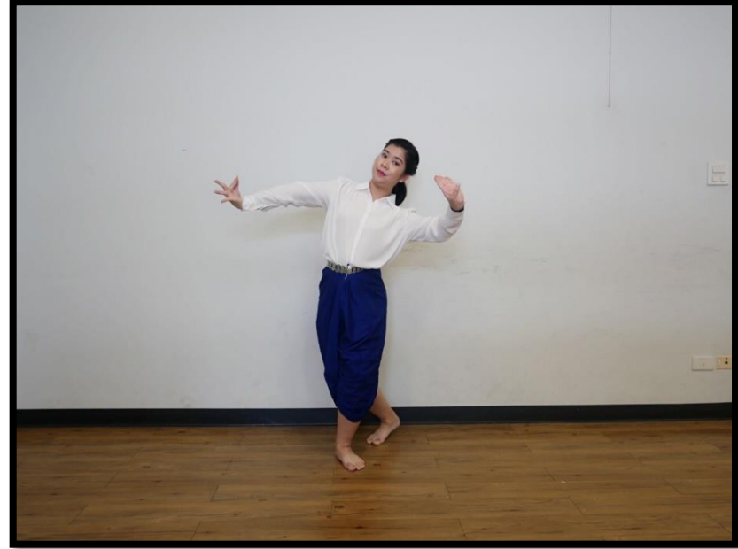
ท่าจีบยาวตัวนาง